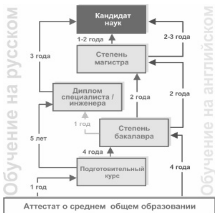
Рис. 2. Схема обучения на русском и английском языке в ТПУ [8]

Томский политехнический университет стал предлагать образовательные услуги для иностранных студентов с 2000 г., когда был создан Институт международного образования. В настоящее время иностранные студенты в ТПУ обучаются в Институте международного образования и языковой коммуникации (ИМОЯК). Профессиональным образовательным программам (бакалавра, специалиста, магистра) на английском и русском языках. Срок обучения включает в себя подготовительную фазу (1 год) и собственно обучение (4–7 лет) (рис. 2). В основном по этим программам обучаются иностранные студенты из Африки и Юго-Восточной Азии (большой частью Китай и Вьетнам) [7. С. 315].