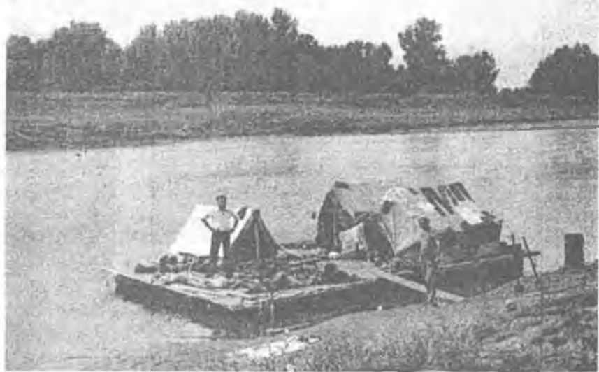
Практика на р. Чумыш (1982 г.)

Я организовывал и проводил интересные учебные практики в Алтайском крае (озёра Телецкое, Ая, Иткуль, реки Чумыш и Чарыш), на Таймыре (Хантайское озеро). При этом все учебные практики были увязаны с потребностями различных организаций. Мы работали по заданиям Алтайского государственного заповедника и Телецкой озёрной станции, Гидрогеологической экспедиции 15-го района, археологической экспедиции Алтайского государственного университета, Айского дома отдыха «Химик», Научно-исследовательского института биологии и биофизики при Томском государственном университете.