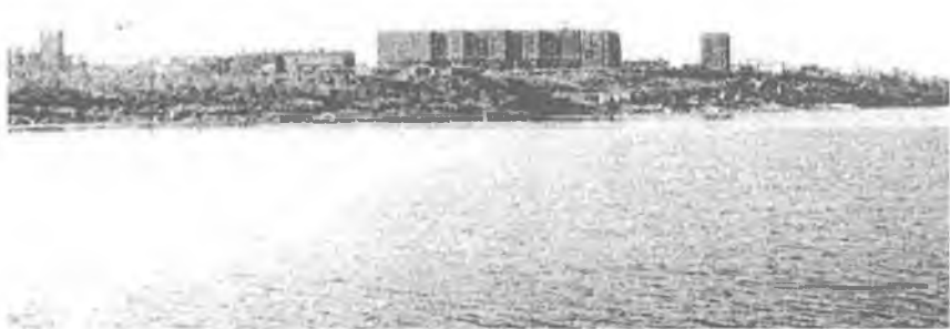
Снежногорск в 1984 г. Здание, где находилась гостиница

Дальше нам предстояло самолетом добираться по маршруту Снежногорск – Норильск – Красноярск – Томск. Маленький аэропорт Снежногорска был закрыт. Волна теплого воздуха навалилась на холодную землю и вызвала густой молочный туман. Туман был настолько густ, что вершину телеграфного столба нельзя было увидеть, стоя рядом. Но по совету бывалых местных жителей мы утром выезжали на автобусе в аэропорт, надеясь, что какой-нибудь заблудившийся вертолёт сделает посадку и добросит нас до Норильска. На Севере такие полёты вне расписания – обычное дело.