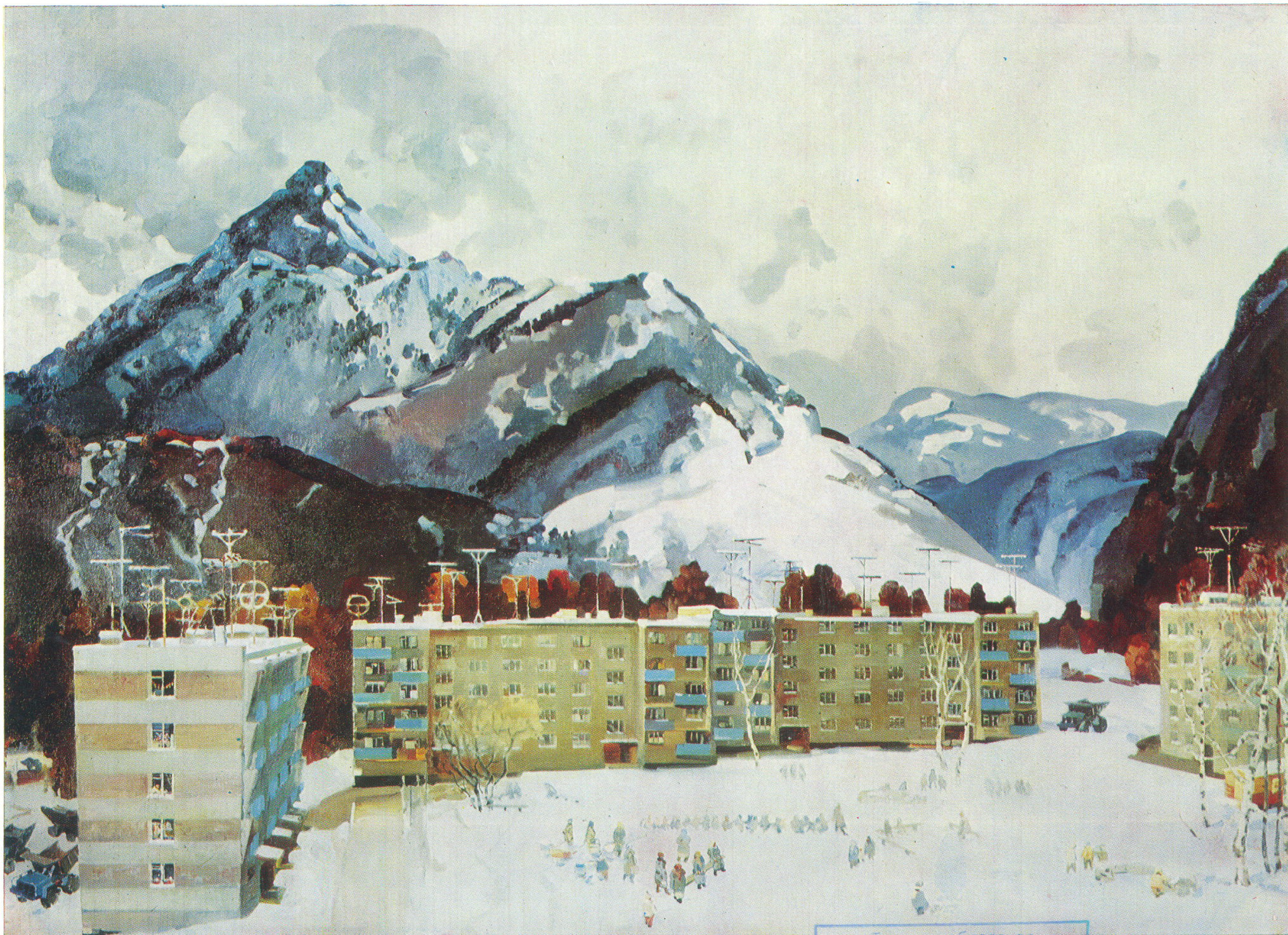
Томская областная библиотека им. А.С. Пушкина