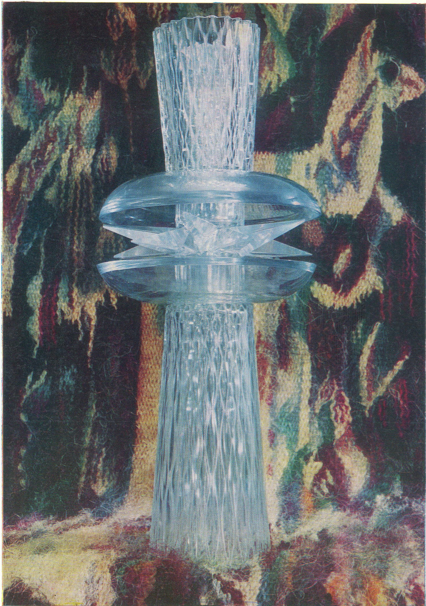
Коллекция «Ломоносовская областная» библиотека им. А.С. Пушкина Инв. №