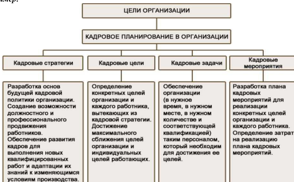
Рисунок 1 – Цели и задачи кадрового планирования в организации