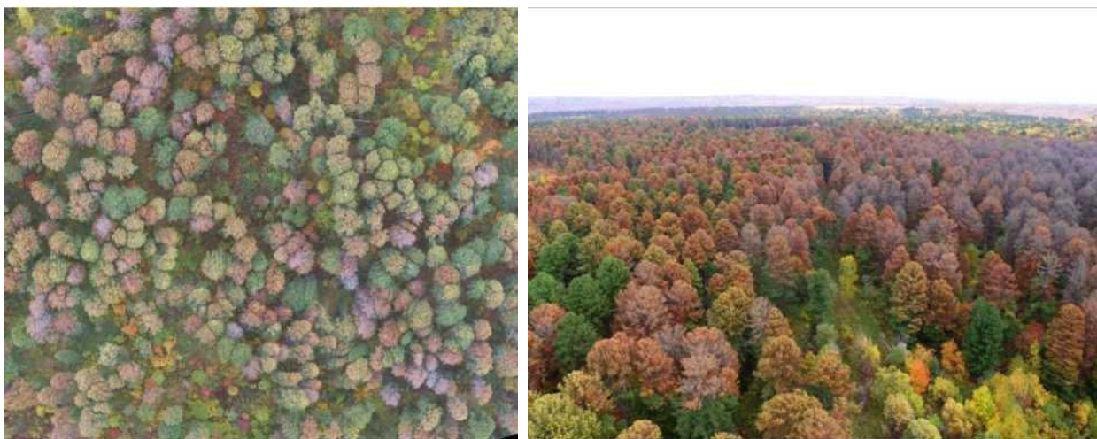
Рисунок 10 – Очаг союзного короеда: Томская область, Томский район, Лучаново-Ипатовский припоселковый кедровник (сентябрь 2019 г.)

Несколько примечаний нумеруют по порядку арабскими цифрами без точки.