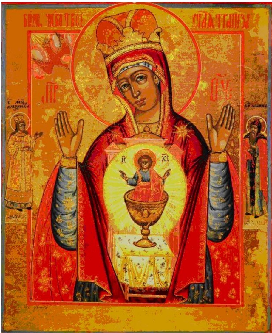
Рис. 1. Икона «Никейская» из ЦАК МДА (начало XIX в.)