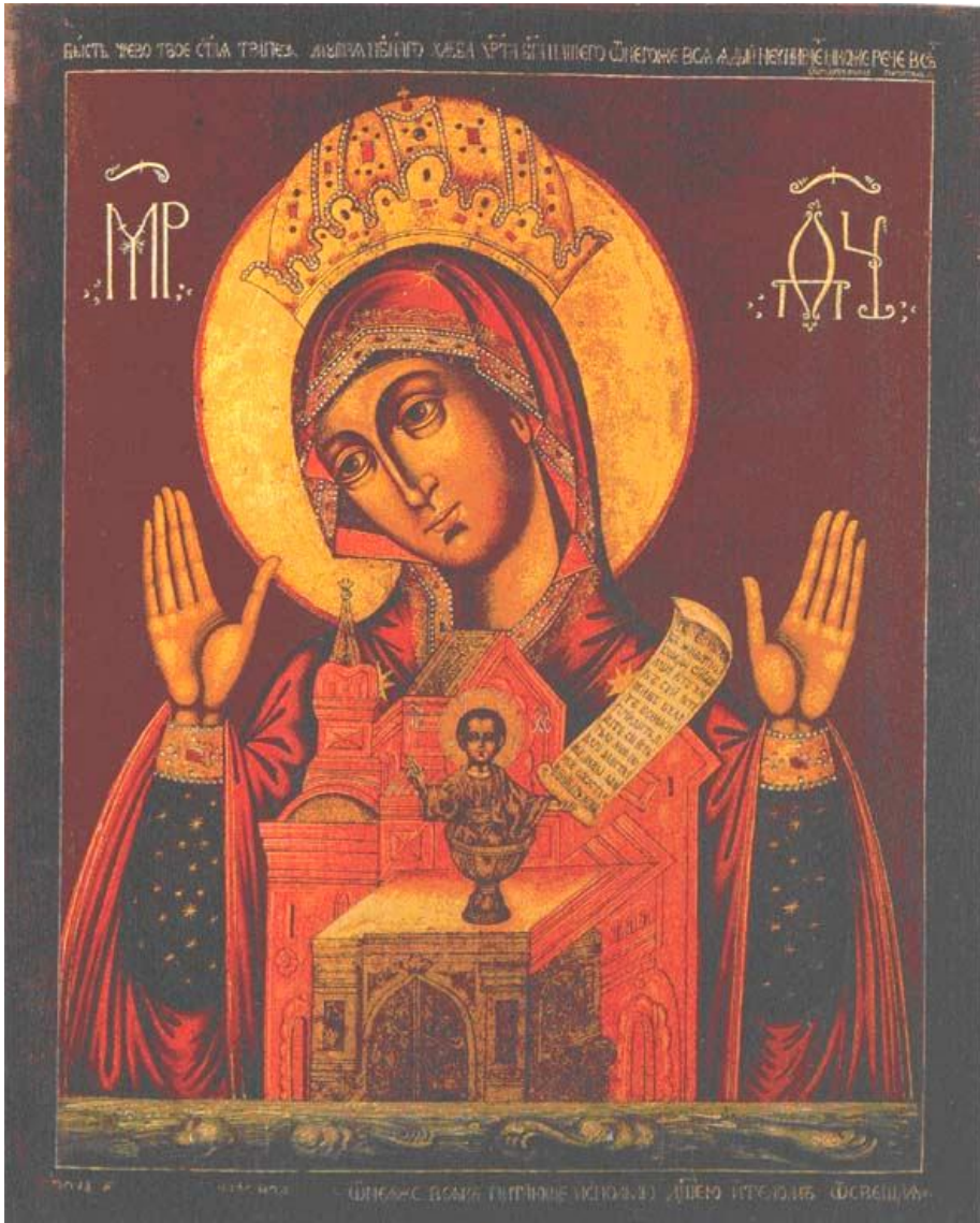
Рис. 3. Икона «Никейская» из собрания Государственного музея истории религии (вторая половина XVIII в.)