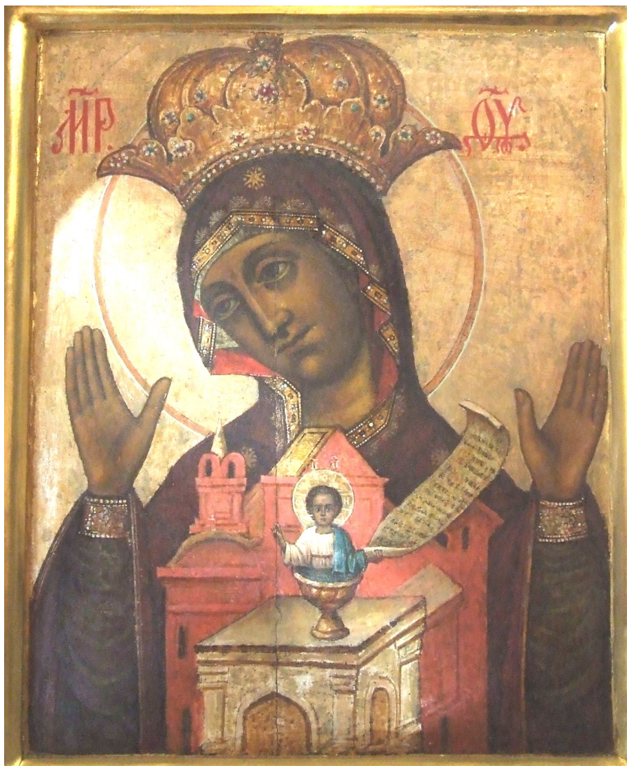
Рис. 2. Икона «Никейская» из храма Рождества Иоанна Предтечи на Пресне (конец XVII в.)