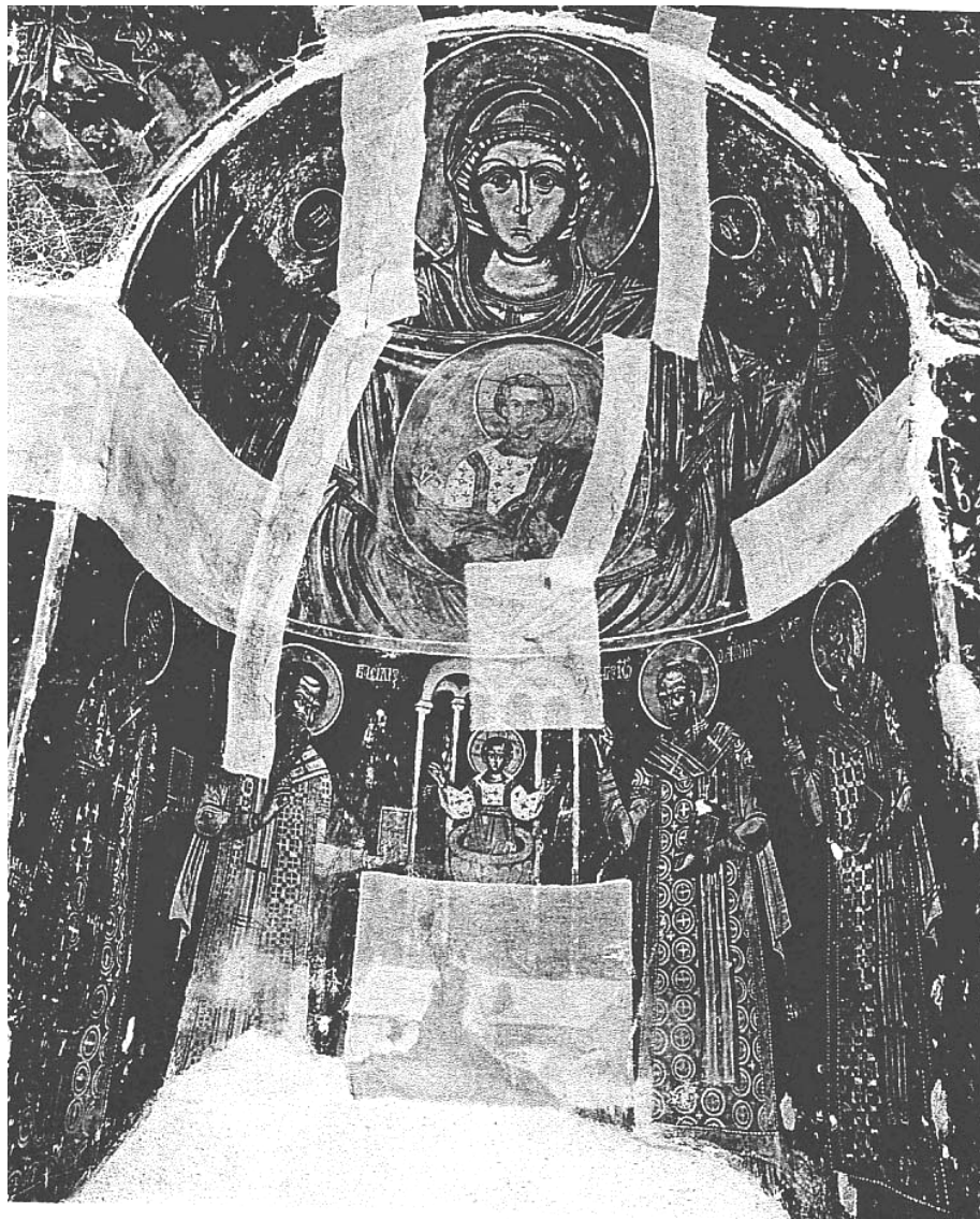
Рис. 5. Апсидальная композиция церкви Св. Николая архонтиссы Теологины в г. Кастория (XVII в.). Ил. из M. Paissidou, Οι τοιχογραφίες του 17ου αιώνα στους ναούς της Καστοριάς. Συμβολή στη μελέτη της μνημειακής ζωγραφικής της Δυτικής Μακεδονίας

сания и западноевропейской живописи, но оно крайне затруднено из-за недоступности архивных документов, связанных с домом Романовых.