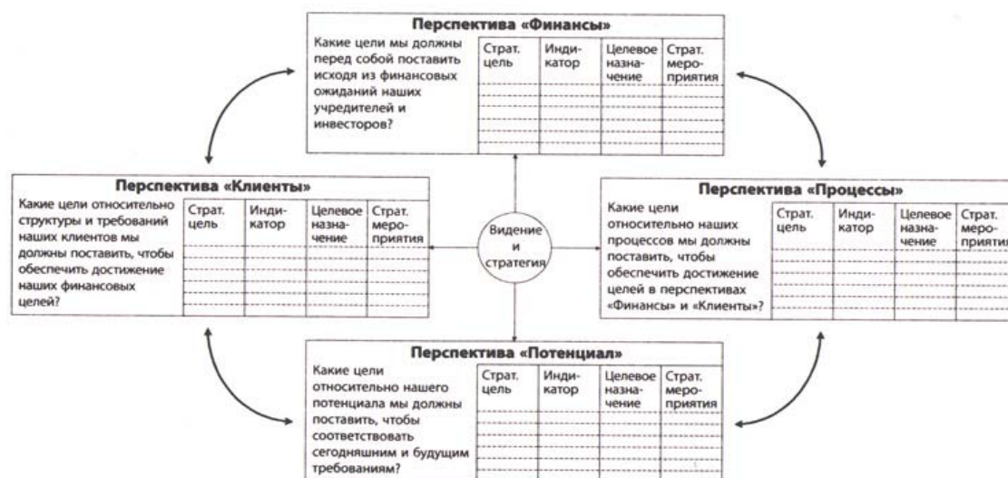
Рисунок 2. Система сбалансированных показателей.

4. Перспектива «Потенциал». Показывает, как должно развиваться предпринимательство, условия его функционирования для соответствия будущим задачам экономики региона и государства через такие показатели, как: направления развития, количественные характеристики роста предпринимательства, участия населения в предпринимательстве, уровень образования, уровень бизнес-культуры, имидж предпринимательства. Включает показатели инфраструктуры развития предпринимательства.