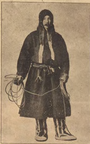
Лѣтній костюмъ самоѣда.