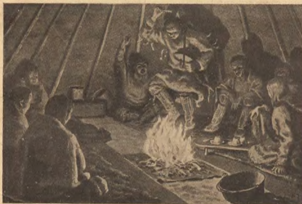
Камланы у самоѣдовъ.

Въ углу ямы на желѣзной рогулькѣ, воткнутой въ подпорку, стояла горящая салная свѣча,