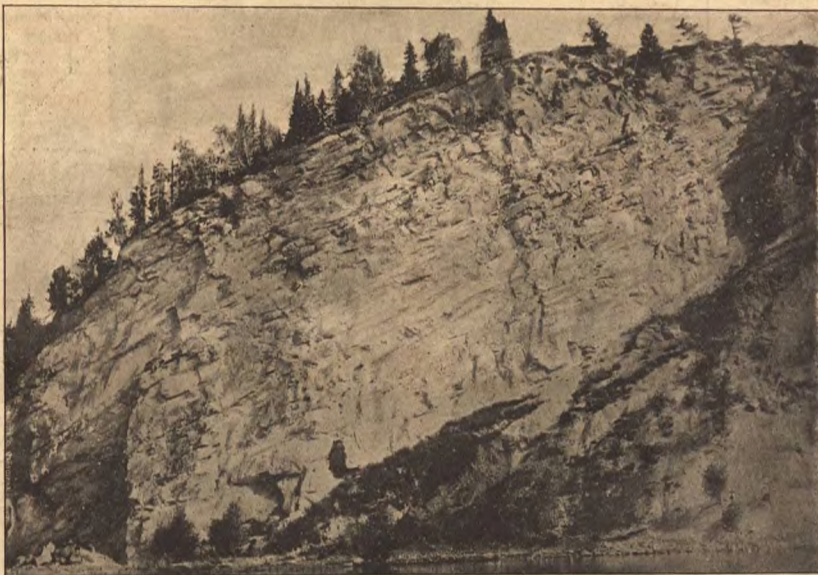
Утѣсь Чѣшь на р. Томи близъ г. Кузнецка.

Есть у самоѣдовъ святани въ лѣсахъ — одиноко стоящіе лиственницы, увѣшанные разноцветными тряпками, мѣдными кольцами и оленьими черепами. Эти лиственницы представляютъ