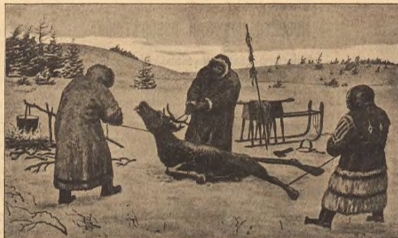
Жертвоприношеніе у самоѣдовъ.

— Ну, ура-о-о-о, Господи благо-слови-и... — сказалъ отецъ и, мускулистыми руками поставивъ бадью на