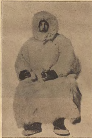
Зимній костюмъ самоѣда.

сейчасъ тебя и закуетъ морозомъ; не успеешь оглянуться, рубашка будетъ, какъ колъ.