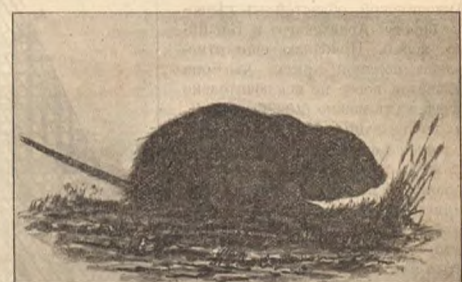
Фиг. 4. „Водяная крыса“.

наго времени могъ считаться Иркутскъ. Однако, недавно я получилъ отъ М. Е. Киборта одинъ экземпляръ пасюка, пойманный на дачѣ д-ра Крутовскаго близъ Красноярска. Этимъ подтверждаетъ сообщеніе Миддендорфа о находженіи пасюка на р. Енисей, къ югу отъ г. Енисейска. Въ этомъ мѣстѣ, стало быть, мы имѣемъ вторую область распространенія пасюка, приближающуюся къ намъ съ востока (см. карту). Но есть и третій пунктъ: Радде и Вальтеръ нашли пасюка въ Красноярскѣ (на картѣ этотъ