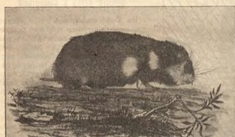
Фиг. 3. Хомякъ обыкновенный.