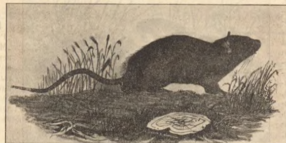
Фиг. 1. Черная крыса.

Но изъ сказаннаго видно, что на одно названіе „крысы“ нельзя полагаться. Разрѣшается, какъ же можетъ отличить неспециалистъ настоящихъ крысъ отъ другихъ грызуновъ, которымъ въ публикѣ дается то же самое названіе, то есть, такъ сказать, отъ крысъ настоящихъ? По отношенію къ нашимъ Западно-Сибирскимъ грызунамъ это довольно легко сдѣлать даже на основаніи однихъ только наружныхъ признаковъ. Настоящія крысы вкратцѣ могутъ быть характеризованы двумя признаками: 1) жевательная поверхность коренныхъ зубовъ у нихъ бугорчатая (по крайней мѣрѣ въ молодомъ возрастѣ), и 2) хвосты у нихъ очень длинныя, такъ что длина его приблизительно равна длинѣ всего остальнаго тѣла, то есть туловища съ головой. Хомякъ, котораго, какъ выше сказано, часто также называютъ крысой, хотя тоже имѣетъ бугорчатые зубы, но хвостъ у него очень короткій; его длина составляетъ не болѣе 1/4 длины тѣла *) . Да и окраска хомяка очень своеобразна.