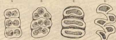
Жевательная поверхность правого передняго верхнечелюстнаго кореннаго зуба: А—обыкновеннаго хомяка, В—рыжей крысы (пасюка), С—короткохвостой или ластовидной крысы (Nesokia brachyura), D—водяной крысы (Microtus leucurus). Увеличеніе въ 7 разъ.

что его сообщенія (въ общемъ описаніи путешествія) о крысахъ въ Сибири могутъ приниматься въ расчетъ только въ томъ случаѣ, если они подтверждаются положительными наблюденіями другихъ изслѣдователей. Не подлежитъ сомнѣнію, что Миддендорфъ бывалъ иной разъ вводитъ въ заблужденіе названіемъ „крысы“, приписывающимся у насъ, какъ выше объяснено, не только къ настоящимъ крысамъ, но и къ нѣкоторымъ другимъ вреднымъ для человѣка крупнымъ грызунамъ.