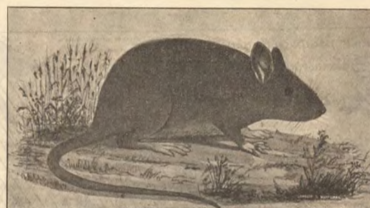
Фиг. 2. Рыжая крыса или пасюкъ.