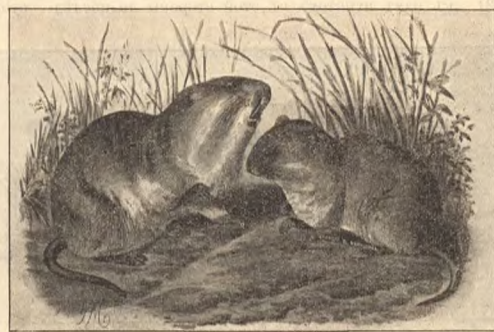
Фиг. 6. Короткохвостая или пластинчатозубая крыса.

К рисункам. Фиг. 2 заимствована из «Русской Фауны» Симашко, фиг. 6 — из «Млекопитающих Пржевальского» Бихнера. Прочие рисунки оригинальны. Чтобы получить естественную величину изображенных здесь животных, следует увеличить их линейные размеры приблизительно в 3 раза, кроме хомяка, которого для той же цели нужно увеличить почти в 4 раза.