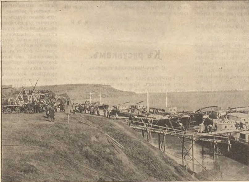
Набережная въ Усть-Чарышской пристани весной.

кія и становились болѣе рыхлыми и пушистыми, и они вновь и вновь принимались за этотъ Сизифовъ трудъ.