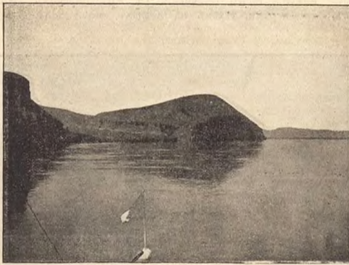
Рис. 4 — Степной Енисей. Оглахты.

— Ты не бойся, Луша, обскажи все какъ было, чего бояться-то. Пужлива она, батюшка,