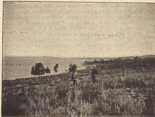
Рис. 6. Озеро Шира.

— Ну, тутъ старосты, дай имъ Богъ здоровья, и нашъ-то, и Ш—й-то писаря привзвали, написали это гумагу, печати приклали и сичаетъ-же это скрутили Абраму руки и въ волость. Онъ исно было и на старостовъ-то съ полъбномъ бросился, ну да они его, дай имъ Господи здоровья, такъ его полъбными поучили, што онъ вы-ы-ы-ль.. вы-ы-ль.. какъ песь какой и дотоль они.. его и мужики-то, это полъбными-то учили, покаль ужъ онъ голо-су не рѣшился и не замеръ. А е-то голдушкы, это Лушу-то, какъ подняли съ дровень-то, такъ, вѣрнш, милостивецъ, едва до избы-то довели.. такъ е слово вотъ вѣтромъ и качаетъ изъ стороны въ сторону, ноженъ-то отнялись, избита вся. Положили ее въ избѣ-то на лавку. Упала я на нее и столь-то это тош-