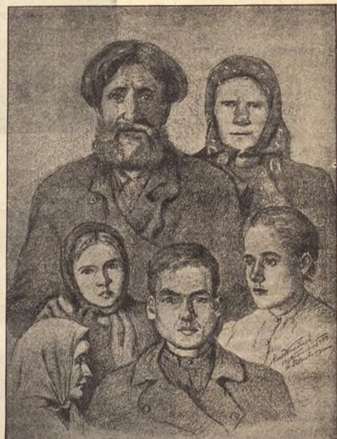
Семья, пришедшая съ золотой рудой пѣшкомъ изъ Томской губерніи въ С.-Петербургъ.

Подробную біографію Поповыхъ, и характеристику ихъ дѣятельности въ Сибири, и значеніе послѣдней для края оставляемъ до другаго раза.