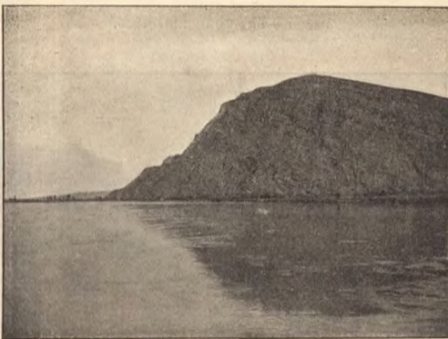
Рис. 5 — Турань.

пособишь, чего дѣлаю, не передѣлаешъ. Ну, ждемъ, авось, думаемъ, образумитъ, придетъ ишо; ждемъ это день—иждѣ, другой и третій—иждѣ Абрама. Старикъ-то хотѣлъ ужъ было къ старостѣ съ объявкой иди, думать ужъ не доспѣлось-ли съ нимъ чего. Только слышамъ, Абрамушко нашъ въ работнику нанялся въ деревню къ хрестянину,—звать-то Спиридономъ, только ужъ чей пишется-то не въ память, не спрашивавъ, женское дѣло-то... Руками только вспенули мы, услышавши это. Гдѣ и умъ у човѣка. Подолобился неволя слаце воли, домухозяиство на батрачество смѣняли. Схватили старикъ-то мой за голову, да такъ, слышь, и упалъ на лавку—вотъ тебѣ и призрѣ и опора въ старости! Погоревали, погоревали это мы, только старикъ-то и говоритъ: „Опомнитесь ишо, прилки это онъ стрѣитъ, устращать хочеть, што вотъ-де поживите-ка безъ меня на старости, поорудите хозяйствомъ, хватить-ли силъ-то, волей да неволей, какъ хворь-то занзиметь да рушиться все пойдетъ, такъ съдѣаете по моему, дадите гугаму иждѣ! Ну, горько-ли, слад-