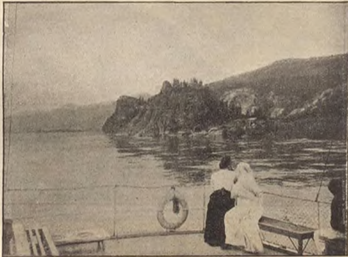
Рис. 2.—Овсянкинъ быкъ.

нихъ, такъ какъ непрерывной береговой полосы не существуетъ, а сложная конфигурація, хотя и невысокихъ, но крутыхъ горныхъ хребтовъ, не даетъ возможности проложить сколько нибудь удобной дороги; даже почтовый трактъ изъ Минусинска на Красноярскъ проведенъ, минуя горы, на Ачинскъ.