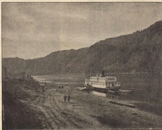
Рис. 3.—Енисей у скита.

На наши души со старикомъ вали грѣхъ. Ну, да вѣдали-ли..