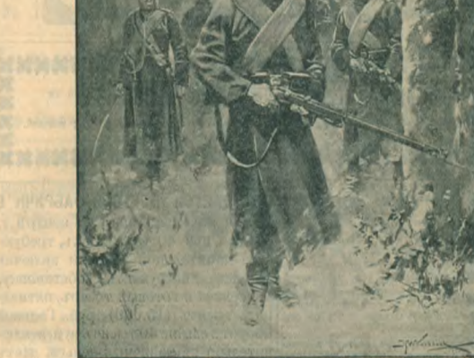
Охотничья команда на развѣдкахъ.