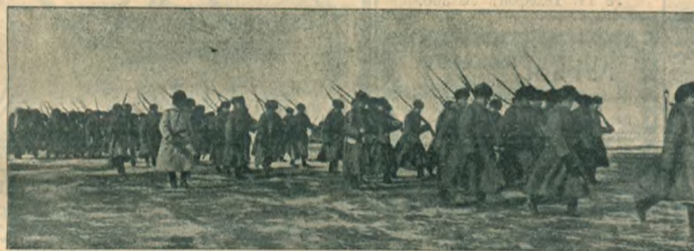
Пехота на озере Байкал.