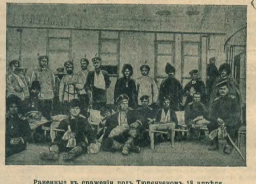
Раненные в сраженіи подъ Тюренченомъ 18 апрѣля.