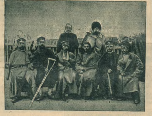
Раненные в дѣлах 8 и 18 апрѣля.