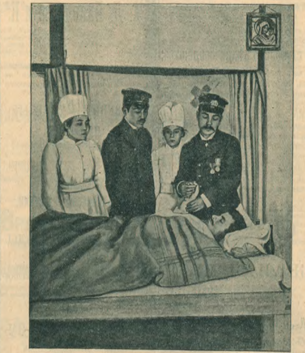
Русский раненый в японском госпитале в Матсуама