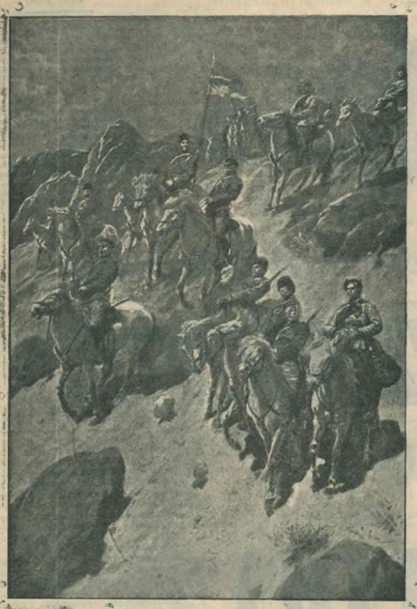
Генерал Рейненкиаффи среди своих казаков.