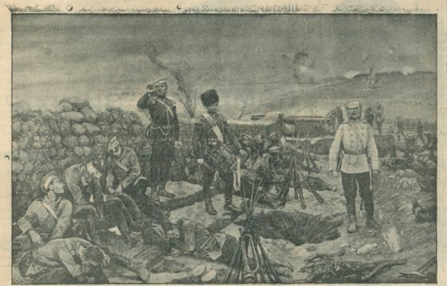
На передовых позициях Порт-Артурса.