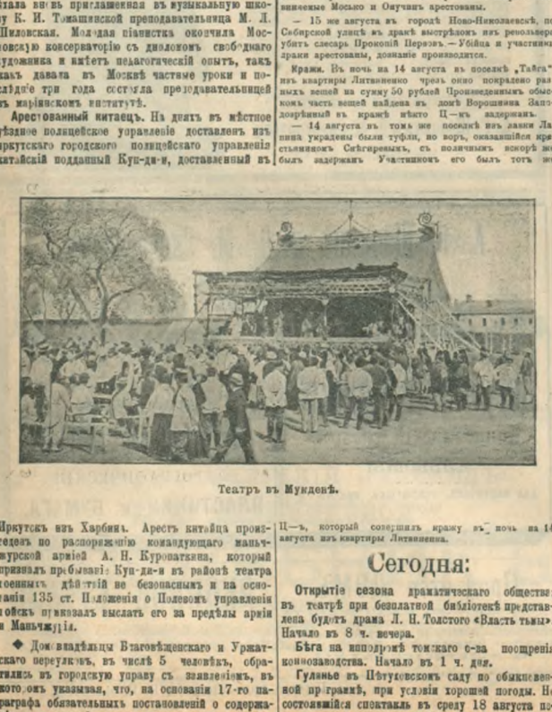
Театръ въ Миндѣ.

Франція. (Шей Х обь образѣ дѣйствій, котораго должны держаться, французскіе католики.) Въ № 7 и въ Unité Catholic, выходящей въ Флоренціи подъ редакціей Сакетти, личнаго друга папы, появились одновременно взаимно подтверждающіе другъ-друга сообщенія, о возмездіи Ша Х.