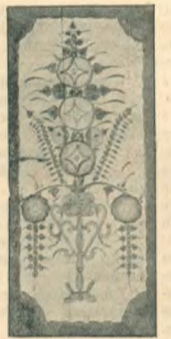
Рисунки на дверяхъ въ жилыхъ комнатахъ у поляковъ.