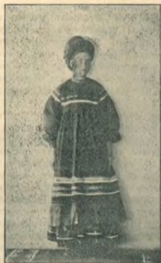
Типы „поляковъ“. Молодая женщина.

Костюмъ поляковъ очень живописенъ. Мужчины и женщины носятъ большей частью яркіе цвѣта, даже шаровары шьютъ изъ пестрой матеріи. Мужчины и женщины ходятъ въ національные костюмы: первые въ рубахахъ-косовороткахъ, вторые въ сарафанахъ. Головной уборъ мужчинъ—лѣтнее шляпа войлочная или соломенная, обвитая вокругъ тулья позументомъ или цвѣтной тесьмой и украшенная у парней перьями и цвѣтами, зимой барашковая шапка съ четырехугольнымъ верхомъ на манеръ конфедератки; женщины, замужнія и