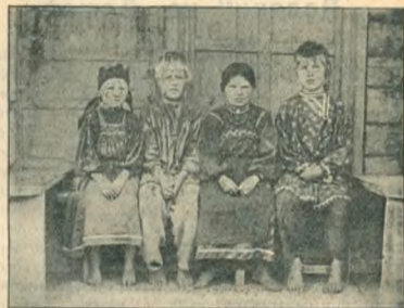
Типы „поляковъ“. Дѣти.