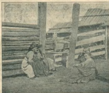
Семейскіе изъ деревни Беклемишевой.