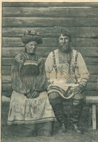
Типы „поляковъ“. Мужчина и женщина среднихъ лѣтъ.

Продолжая дѣлаться на секты, каждая изъ которыхъ въ большинствѣ селеній имѣетъ не только свой отдѣльный молитвенный домъ, но даже и свое кладбище, старообрядцы поляки въ то-же время сами не знаютъ, что именно раздѣляетъ ихъ меж-