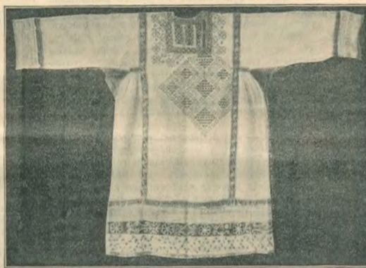
Одежда поляковъ. Мужская вышитая рубаха спереди.