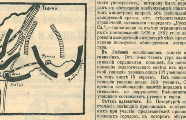
Къ Mukdenскому бою. Схема 'расположения' сторон въ моментъ, когда русская армия была сломлена и началось общее отступление.

Библиография. Библиотона для дѣтей и юношества под ред. Горбунова-Поссадова. М. Богдановъ. Что такое птица? Осенний перелет птиц. Цѣна 12 коп.