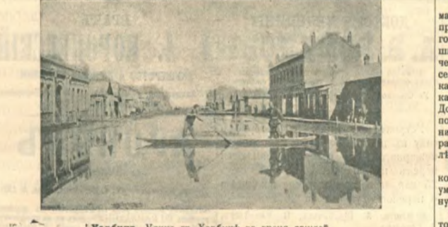
Харбинь. Улица въ Харбинѣ во время дождей.