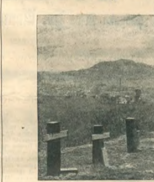
Высшие военные чины Манчжурской армии.

Значение морского сражения в Корейском проливе. Обсуждая полученные телеграммы о нашем поражении на море, "Русск. В." замечает: "от нашей грозной эскадры, для формирования которой Россия должна была направить столько сил, получивших ничтожные остатки, почти не имеющее серьезного боевого значения. Это поражение по своим размерам и результатам превосходит то, чем было на суше мунденское поражение. Для сухопутной армии еще оставалась явная возможность победы в будущем; в настоящем случае подобной победы не остается, так как морских резервов, на которые можно было рассчитывать, уже нет".