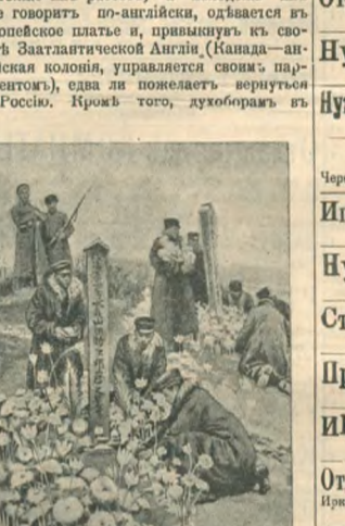
Планные японцы на могилах своих умерших товарищей в с. Медвиль, Новгородской губернии.

Парижская социалистическая группа заявляет о своем твердом намерении продолжать ежедневную борьбу со всеми формами реакции. Ввиду политики республиканского блоа, результаты которой при содействии всех избранных социалистами депутатов без исключения, единодушно признаны всеми, будет и впредь предлагать, или поддерживать и стараться проводить, при помощи тленного единения республиканцев левой, неограниченной реформы, которая может, даже при существующем социальном строе, улучшить положение всех работников.