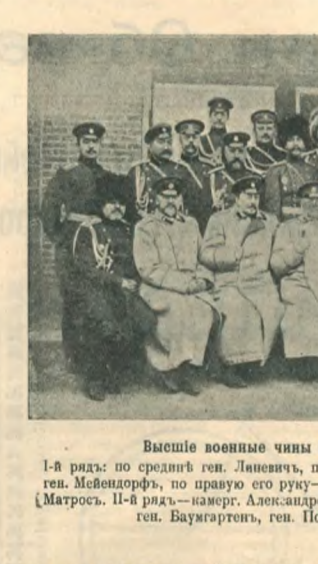
Высшие военные чины Манчжурской армии.

деств своего постоянного или временного дробления, ни при перепадах из одного места на другое, крохи: 1) еврей, постоянно проживающий в их черты или осёдлости; 2) лит, состоящих под надзором полиции по судебным приговорам или постановлением административной власти; 3) иностранцев, прибывающих в Россию. Удостоверения о самоличности выдаются в форме бесспорной паспортной книжки, которая обязана иметь как все, проживающие в Петербурге, Москвитин и Варшав, так и все прибывающие в эти города. Для удостоверения заявления и требований полиции звания, имени, отчества, фамилии, возраста, места постоянного жительства и отношения к отбыванию воинской повинности могут служить, кроме паспортных книжек, метрическое свидетельство или метрическая выписка, аттестаты учебных заведений, документы по воинской повинности, удостоверения правительственных и общественных учреждений, торговые документы и всякие другие доку-