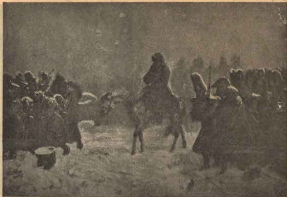
Отступление. Карт. Нортона