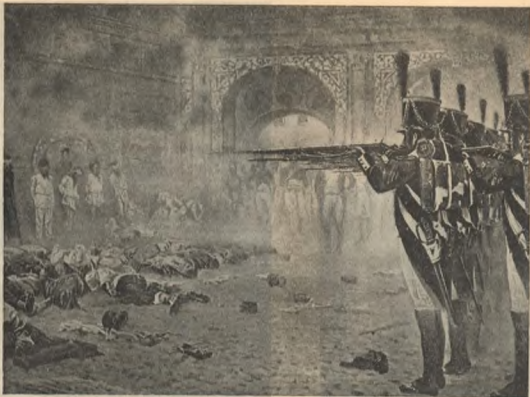
Разстрѣлъ поджигателей. Карт. Вережагина.