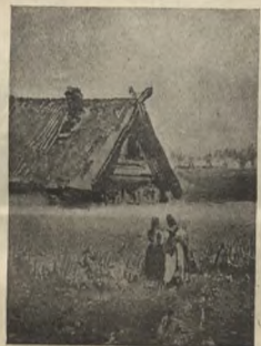
Изаба въ Фляхъ.