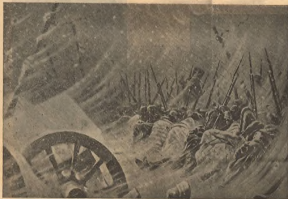
Ночной привалъ. Карт. Верещагина.

Исп. об. редактора А. П. Толескаго. Издатель Сибирское Т-во Печати. Дтл.