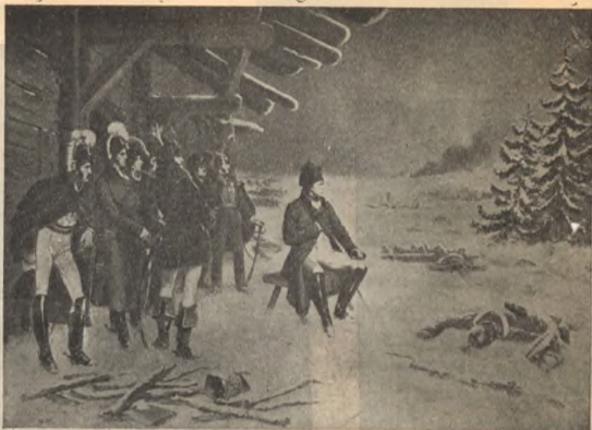
У Малаго Ярославца (Карт. Бакаловича.)