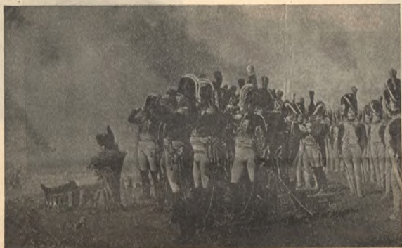
На Бординскихъ высотахъ. Карт. Верещагина.