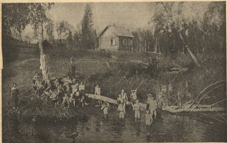
На рѣкѣ Басандайкѣ.