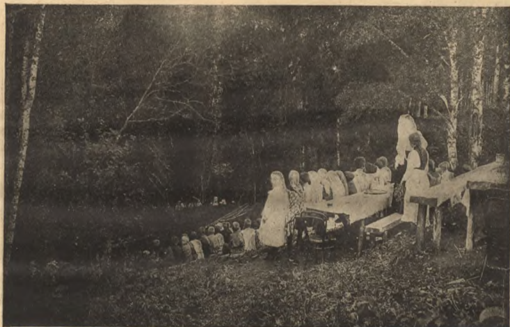
Спектакль въ лѣсу.