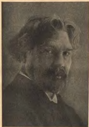
В. И. Суриковъ. Художникъ-зибирякъ.