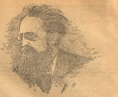
ЖЮЛЬ ГЭДЬ, лидер французской социалистической партии...