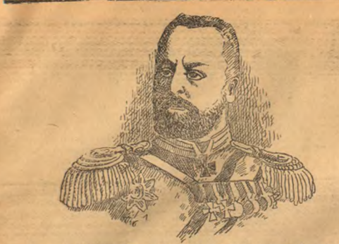
Ген. САМОНОВЪ, убитый въ бою подъ Сольдау.

милитаризма, но въ его гнѣву относительс... уваженію. Германъ въ глѣзѣхъ европ... общественнаго мнѣнія стояла, какъ фактъ оружія. Тотъ и въ послѣд... в грядущемъ, сямъ. Смыслъ же въ ней... ворочъ въ сѣ, надѣясь только на войну.