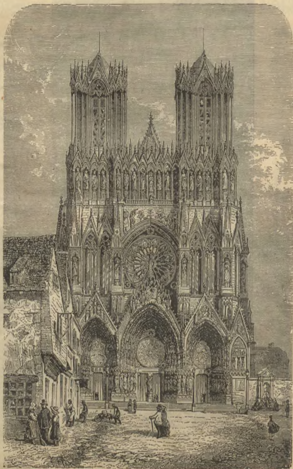
Соборъ въ Реймсѣ, фасадъ.