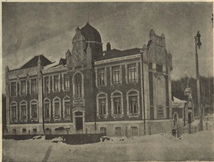
Городское училище имени Пирогова въ Томскѣ.