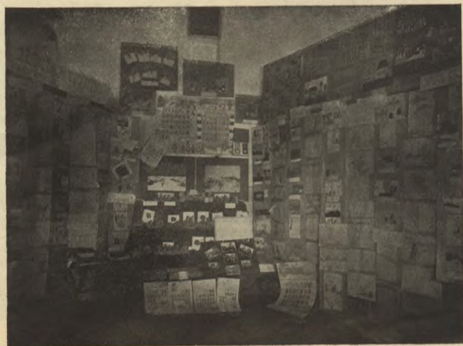
Выставка „Дѣтскій трудъ и отдыхъ“, бывшая весной 1914 г. въ г. Томскѣ.