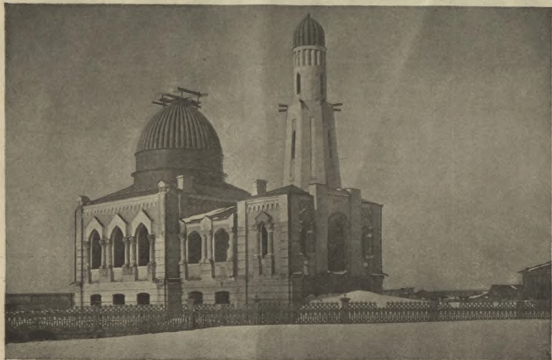
Новая мечеть въ г. Томскѣ.