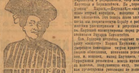
Гов. Клара Цеткин.

Вопрос о разработке общей для всех социал-демократических программ.