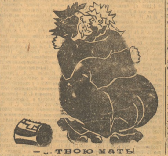
—... ТВОЮ МАТЬ!

дах, у св. Анны, в разных монастырях и храмах, открылось 2 туловища, 8 голов и 6 рук. У Андрея Первозванного открылось 5 туловищ, 6 голов и 17 рук. У св. Антония—на 4 туловища 1 голова, а у св. Елены наборот, на 4 туловища 6 голов. Поистине, путанная бухгалтерия и удивительная наглость.