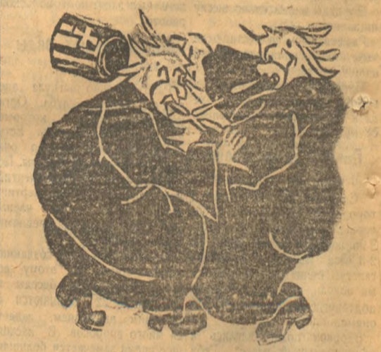
— Нет, ты больше!!..