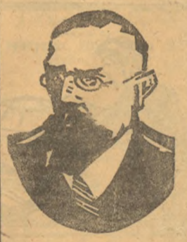
Тов. М. Н. Покровский. Основатель рабочего факультета в России. Один из виднейших историков-марксистов.

20-го мая, в 1920 году—открылся рабочий факультет. В большом городском театре (был гарлаб) торжественное заседание представителей губерния, губернского комитета, профсоюзной и др. С'ехавшись с разных окраин Сибири, оторванные от стаяки и лагуа, молодые рабфакцы собрались и с едва заметными волнениями ждали открытия заседания. Самихся одержанный шепот. Наконец, заседание открывается, в комнате звучит «Интернационал» раздается в огромном зале