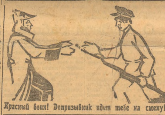
Красный воин! Допризывник идет тебе на смеху!

Мы, комсомольцы, приехавшие в тоцкий рабфак на рабочих районы, встретили там организацию РКМ в период уюла работы. Так как в ней не было предельного духа, и в большинстве своем были представители интеллигенции и обывателей,—работа заиграй, нам нужно было поднять ее, а в первую очередь начать работу внутри рабфака. И взял наш интеллект, обчлнл запись в комсомольскую ячейку—всего записались 35 человек. На собрании было избрано бюро из семи. Аргументы и еще одного (фамилию не пишу)—работа начала налаживаться. Начавшая зреть своя ячейка входить на территорию, про много там перерегистрацию и отделение оздоровления состав. Вскоре ячейковых руководителей не предвзятым. Автеритет ячейки возрос до того, что все боя как не отармывали даже обыватели. Так начиналась наша первая работа. Честно скажу, что в один день назначалось несколько собраний, но знаешь, куда эти борются с авидизмом, но, а как