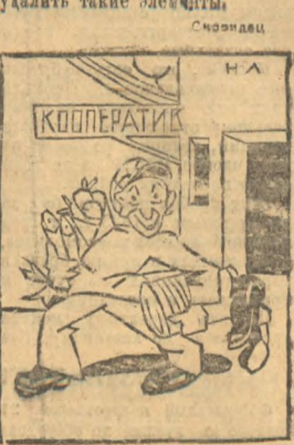
НЕКТО С КРАДЧЕВИМ—ЧТО ЗА БЛАГОДЕТЕЛЬНЫЕ УЧРЕЖДЕНИЯ—ЭТИ КООПЕРАТИВЫ. ЕСЛИ БЫ ИХ НЕ БЫЛО, ИХ НАДО БЫЛО БЫ ВЫДУМАТЬ

Безусловно, если это так будет продолжаться в дальнейшее, то рабочим не увидит расширения кооперации химзавода, а что есть в ней, то и последнее растащит. Чтобы не было этого, нужно удалить такие элементы.