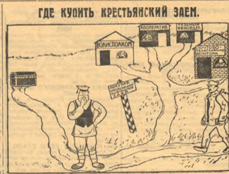
Есть у меня немного денег. В кубышку положить или крестьянский заем купить? У вас, сосед-работник в деревню в отпуск идет. Ой мне по дешовке за 90 копеек заем крестьянский продает.

Уже в прошлом году кооперация во многом облегчала крестьянину сдачу одного налога. Вместо того, чтобы провозить хлеб и другие продукты своего хозяйства за бесценок частному скупщику, крестьяне во многих местах имели возможность сдавать эти продукты по выгодной цене в кооператив.