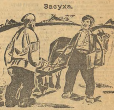
Засуха. Не ходил бы ты, дед, за сохой — Не был бы с засухой.

Температура в Челябинске сильно понижалась, идет дождь со снегом. В Златоусте выпал первый снег.