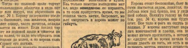
Выпадение влагалища. Выпадение влагалища.