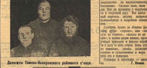
Делегаты Томско-Коларовского районного с'езда.