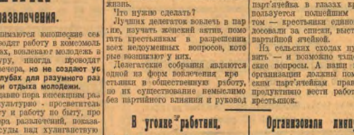
Крестьянка, следуй заветам ЛЕНИНА!