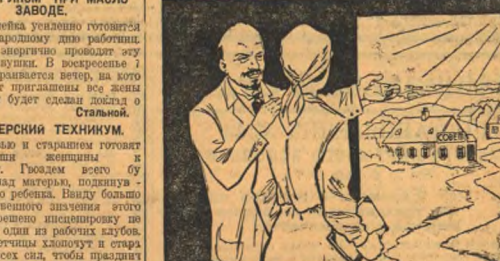
Крестьянка, следуй заветам ЛЕНИНА!

Каждому шахтеру, так и сделать надо. Шахтеры должны быть активными участниками в борьбе с преступным хулиганством. Шахтеры должны быть активными участниками в борьбе с преступным хулиганством.