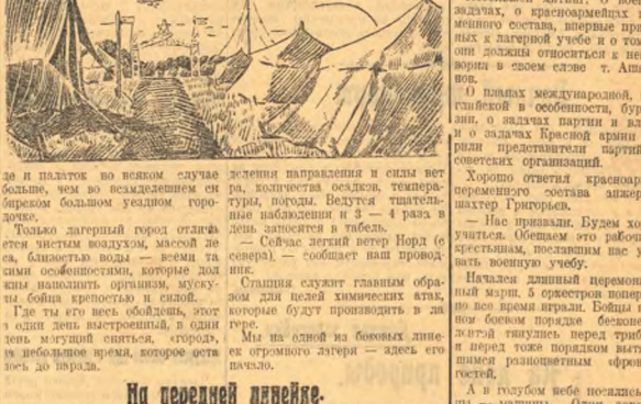
Парад открылся торжественно. Шахтеры в большом количестве уехали в дом отдыха.

Делегаты делегатов. Шахтеры в большом количестве уехали в дом отдыха.