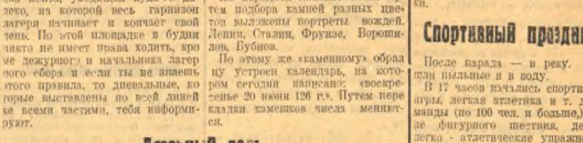
Парад открылся торжественно. Шахтеры в большом количестве уехали в дом отдыха.