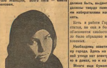
Есть в работе Горосвета и недостатки, но они в большинстве своем являются слабостью бюджета.