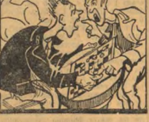
Игры играют только по телефону. Не надо работать дежурным телефона.

Телефонисты от Тагга Глушова и Яероф чуть не каждый день в телефоне играют в покер. Во время