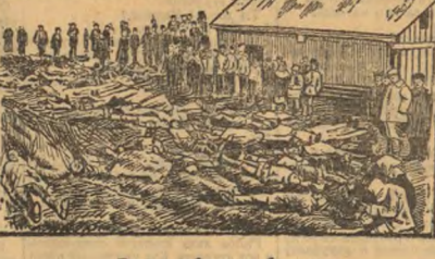
Группы рабочих у больницы.