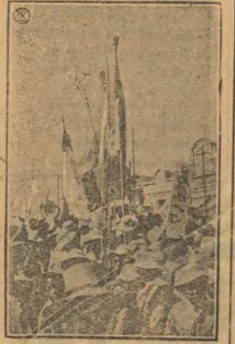
Известия о победах пролетариата Советского Союза, свободных от дома (использование).