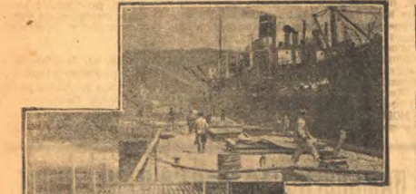
Вверху — погрузка цемента на паровоз. Внизу — загрузка цемента на цементном прессе, предназначенном в отправление за границу.