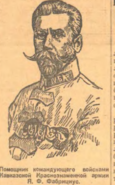
Помощник командующего войсками Кавказской Краснознаменной армии Я. Ф. Фабрициус.