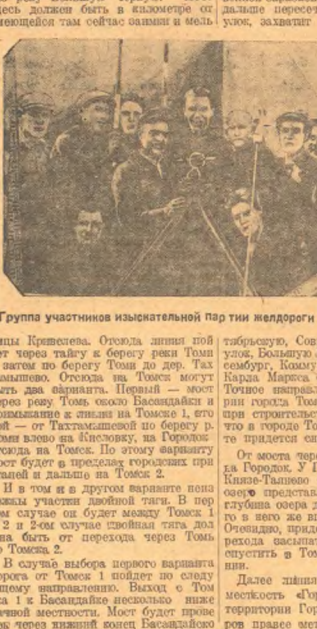
Группа участников изыскательной партии медгород Томск — Болонья.