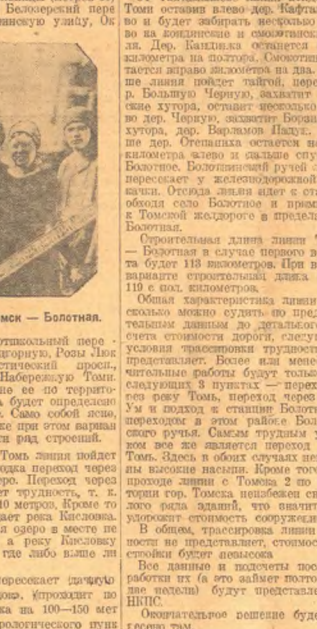
Группа участников изыскательной партии медгород Томск — Болонья.