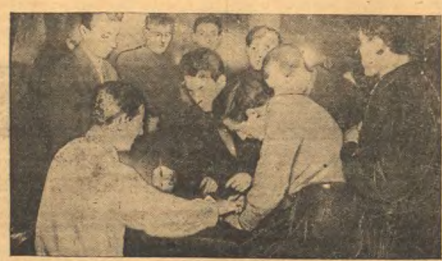
На межрайонной городской конференции в Томске. Подписывает делегаты политический договор об участии профсоюзов в хлебозаготовительной кампании.