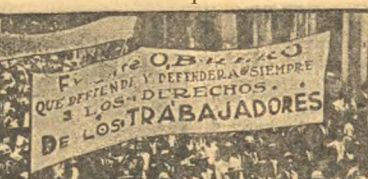
Работники г. Мессенго были организованы традиционной демонстрацией на улицах города, протестовавшей против нежелательного проведения закона о труде. С 1917 года на один из мексиканских конгрессов не имел достаточно времени для проведения традиционной демонстрации и коммюнисты в этот момент поспешили провести демонстрацию в знак протеста против закона о труде, считая, что этот напечатанный удар мексиканской промышленности.

Сломим попытку кулаков задержать хлеб СОВЕЩАНИЕ ХЛЕБОЗАГОТОВИТЕЛЕЙ ПРИ НАРКОМПТОРЕ СССР. Состоявшееся собрание работников хлебозаготовительных организаций совместно с представителями фабрик и заводов пришло к выводу, что для выполнения плана хлебозаготовок необходимо использовать все возможности и средства, находящиеся в распоряжении работников хлебозаготовительных организаций. «Успешный ход хлебозаготовки в текущем году полностью зависит от своевременности и правильности выполнения плана хлебозаготовки. Поэтому необходимо использовать все возможности и средства, находящиеся в распоряжении работников хлебозаготовительных организаций.