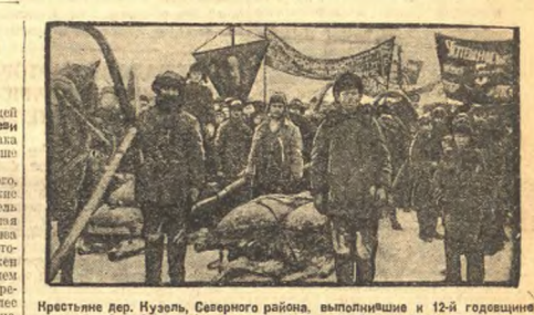
Преступление дер. Кузнец, Северного района, выполнившие и 12-й годовщине Октября хлебозаготовки на 50 проц. больше задания.