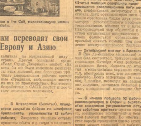
На политических занятиях по имени в 1-м Сиб. политехникуме имени Тимирязева.

НЬЮ-Йорк, 29. Пять из тридцати компаний, работающих в экономике США, выводят свои предприятия в Европу и Азию.