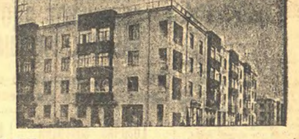
По СССР строятся тысячи и тысячи новых удобных домов для рабочих. На снимке — вновь выстроенный в Бrienно домочульца.