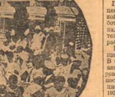
Во время сессии национального конгресса в Индии там проходили массовые демонстрации под лозунгом борьбы за освобождение от английского владычества. На снимке — демонстрация.

— Советские самолеты и мотопланеры. Аэроплановая комиссия по проектированию самолетов „Левая Машина“ в течение 1930 года должна будет изготовить 10 самолетов „Левая Машина“ и 10 мотопланеров „Левая Машина“.