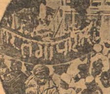
Во время сессии национального конгресса в Индии там проходили массовые демонстрации под лозунгом борьбы за освобождение от английского владычества. На снимке — демонстрация.

— Советские самолеты и мотопланеры. Аэроплановая комиссия по проектированию самолетов „Левая Машина“ в течение 1930 года должна будет изготовить 10 самолетов „Левая Машина“ и 10 мотопланеров „Левая Машина“.