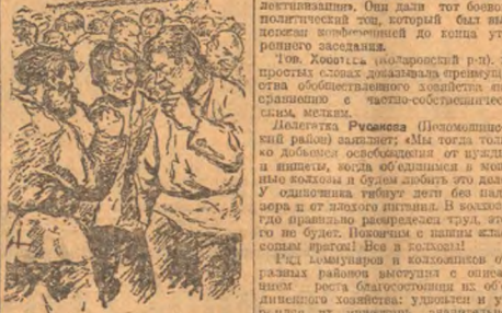
На конференции во время перемены.

Чрезвычайно важное значение имеет вопрос об организации труда в колхозах. Необходимо... (Text focuses on labor organization and productivity in collective farms.)