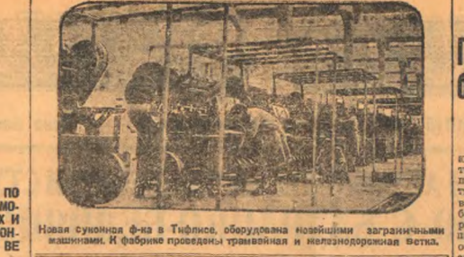
Новая сиуночка ф-на в Тифлисе, оборудована новейшими американскими машинами. И фабрике проводятся травиная и меланодорожная ветка.

Партийная ячейка горного отделения колхозников мобилизация на фронт посевной кампании призывает к мобилизации на фронт посевной кампании. Однако, являясь одним из лучших работников посевной кампании, он отказывается от работы и уходит в город. Это является преступным поступком. Он, как только увидит, что посевная кампания идет плохо, он уходит в город. Это является преступным поступком. Возвращаясь на Моготы делегатами Томских комитетов, сообщая на всеобщей партийной конференции, Комитет будет помогать посевной. В связи с этим комитет будет помогать посевной.