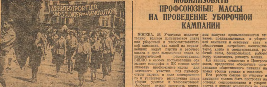
Свет красных физкультурников в Эрфурте (Германия). На сцене демонстрация по городу с лозунгом: «Рабочие физкультурники — солдаты революции».

Снабженец отмечает в предлах Таежного, Петуховского, Алдатовского и Мариновского лесничеств нарушения в отношении лесных ресурсов. В связи с этим, необходимо срочно принять меры для улучшения общественного питания рабочих. В связи с этим, необходимо срочно принять меры для улучшения общественного питания рабочих.