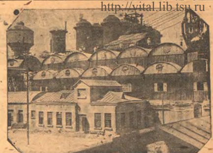
Мурманский металлургический завод им. Войкова.