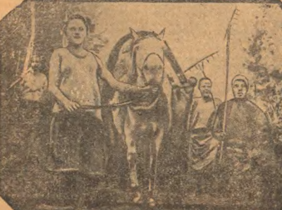
С. Пугачев. Единичники отправляют югов на мятеж.

НОВОСИБИРСК, 16. Краевой партии принята постановление о реорганизации снабжения сельскохозяйственной техникой в крае. Будет организованная межрайонная сеть складов Сибсельскалада в размерах, обеспечивающих бесперебойность снабжения совхозов и колхозов. Существенно просрочены сроки выполнения поставок в колхозы и совхозы. Складов сельскохозяйственной техники Сибсельскалада передается в распоряжение колхозов, обеспечивая точность части сельскохозяйственного и запасных частей.