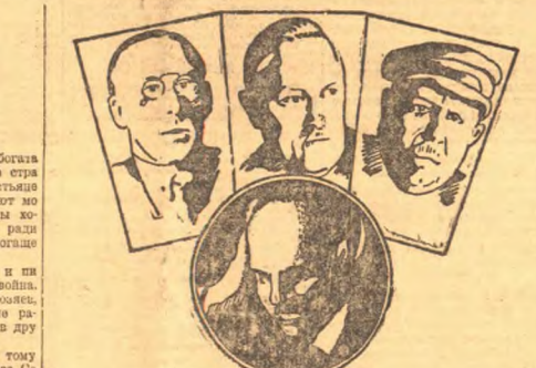
Сотра суда по делу контрреволюционной организации „ПРОПАРТИ“ НАЧАЛОСЬ СЛУШАНИЕ.

Капиталистическая пресса уже две недели пытается доказать, что дело „Диринка“ искусственно создано. Самые разные образцы вымысла и сенсации на страницах капиталистической и социалистической прессы замалчивают истинную картину этого дела. Диринка и др. Основное — раскрыть планы интервенции, искусственно объявляя ее несуществующей. Мы должны знать, что такое интервенция, как она осуществляется, как она осуществляется, как она осуществляется. Мы должны знать, что такое интервенция, как она осуществляется, как она осуществляется. Мы должны знать, что такое интервенция, как она осуществляется, как она осуществляется.