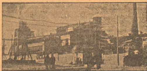
СТРОИМ БОЛЬШОЙ КУЗБАСС. В Анжеро-Судженске заканчиваются работы по расширению центральной электростанции.