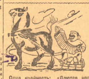
Одна крайность: «Даются нормы крайне малые в результате чего не используются машины, инвентарь и труд колхозников».

По данным Райколхозсоюза переход колхозов на сдельщину в основном по району закончен. Но в ряде случаев переход на сдельщину носит формальный характер. Заключается она в том, что нет точного учета труда колхозника, плохо организован труд, установленные нормы выработки и оценки труда не доведены до каждого колхозника. Формальный переход на сдельщину очень скоро дает себя чувствовать. Первые же дни выезда в поле с наглядной очевидностью до казывают недостатки формального перехода на сдельщину. Урожаи остаются ниже, чем в предшествующие годы. Вовсе недостаточной также является помощь новым колхозам со стороны старых, имеющих опыт работы. Райколхозсоюз пока не организовал этой помощи. «Поэтому необходимо во много раз усилить помощь новым колхозам посылкой опытных колхозников из старых колхозов на первые дни сева специально для налаживания сдельщной работы» (постановление НКЗ СССР).