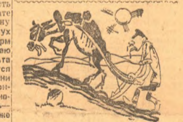
Другая крайность: даются нормы непосильные даже для опытных и старательных колхозников».

Кулак, учитывая малопытность колхозов в переходе на сдельщину, использует в своей борьбе с колхозом свое преимущество.