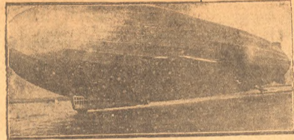
Дирижабль, вылетающий в ближайшее время на северный полюс. В экспедиции принимают участие советские ученые.